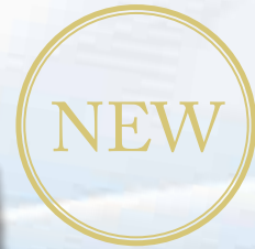
立ち作業用制電マット S FE302-82