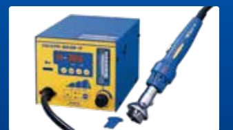
ホットエアー FR-803B ※販売終了