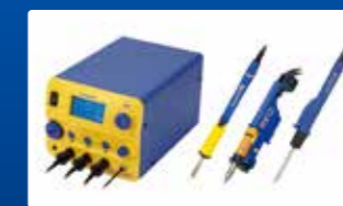
リワークシステム FM-206 ※連動はホットエアーごて部 (FM-2029) のみ可能